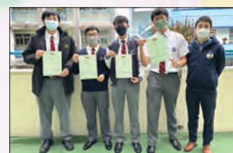
得獎同學與負責老師合照