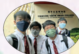
參賽同學於張祝珊英文中學合照

本學年學校共提名四位中六同學參與2022-23香港生物學素養競賽。是次比賽讓同學應用所學生物學概念和技巧，以處理實驗數據、科學思維和創意解難問題。本校團隊最後於初賽取得理想成績，當中更有同學之分數為全港參加者頭 5% 之列，取得一等獎 First class honour。