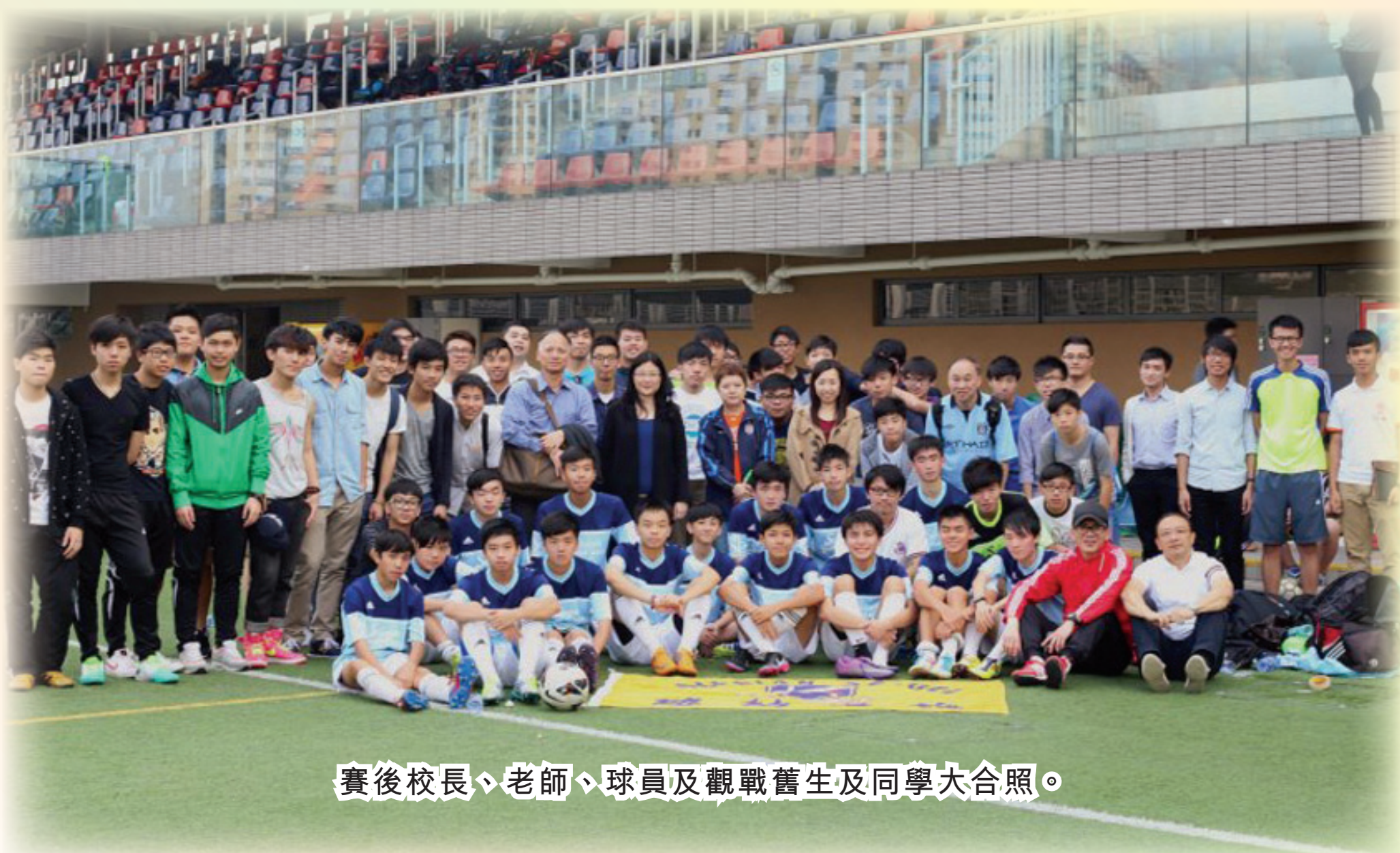
賽後校長、老師、球員及觀戰舊生及同學大合照。