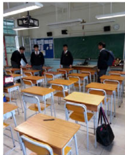
● 慈幼仔勇於承擔責任清潔課室

師弟們！相信你們必定會在慈幼這大家庭中建立以上優良特質，令「慈幼仔」這尊稱繼續發光發熱！