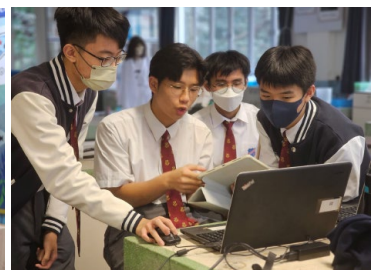
3. 本屆項目負責人為展覽作最後準備