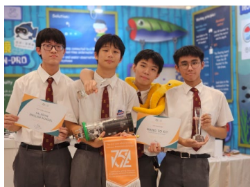
2. 本屆項目負責人與獎項合照