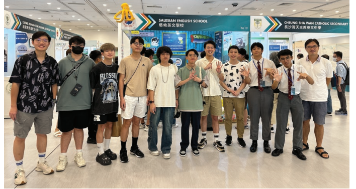
7. 本屆項目負責人與過往不同屆別的科展團隊成員合照 (由左起: 51st, 54th, 52nd, 49th 及本屆57th)