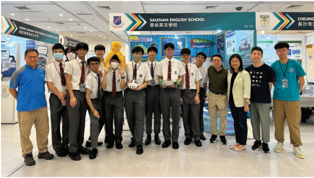
6. 同學與校監、校長及副校長合照