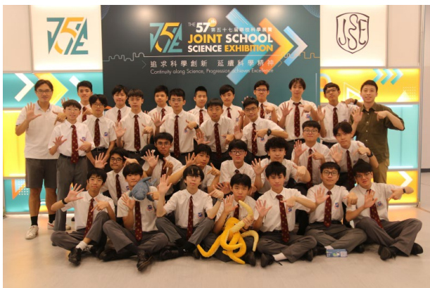
1. 最後展覽日全體參賽同學合照