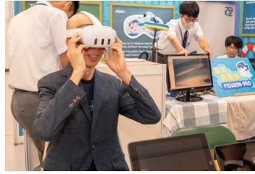
4. 前環境局局長黃錦星先生試用本校產品